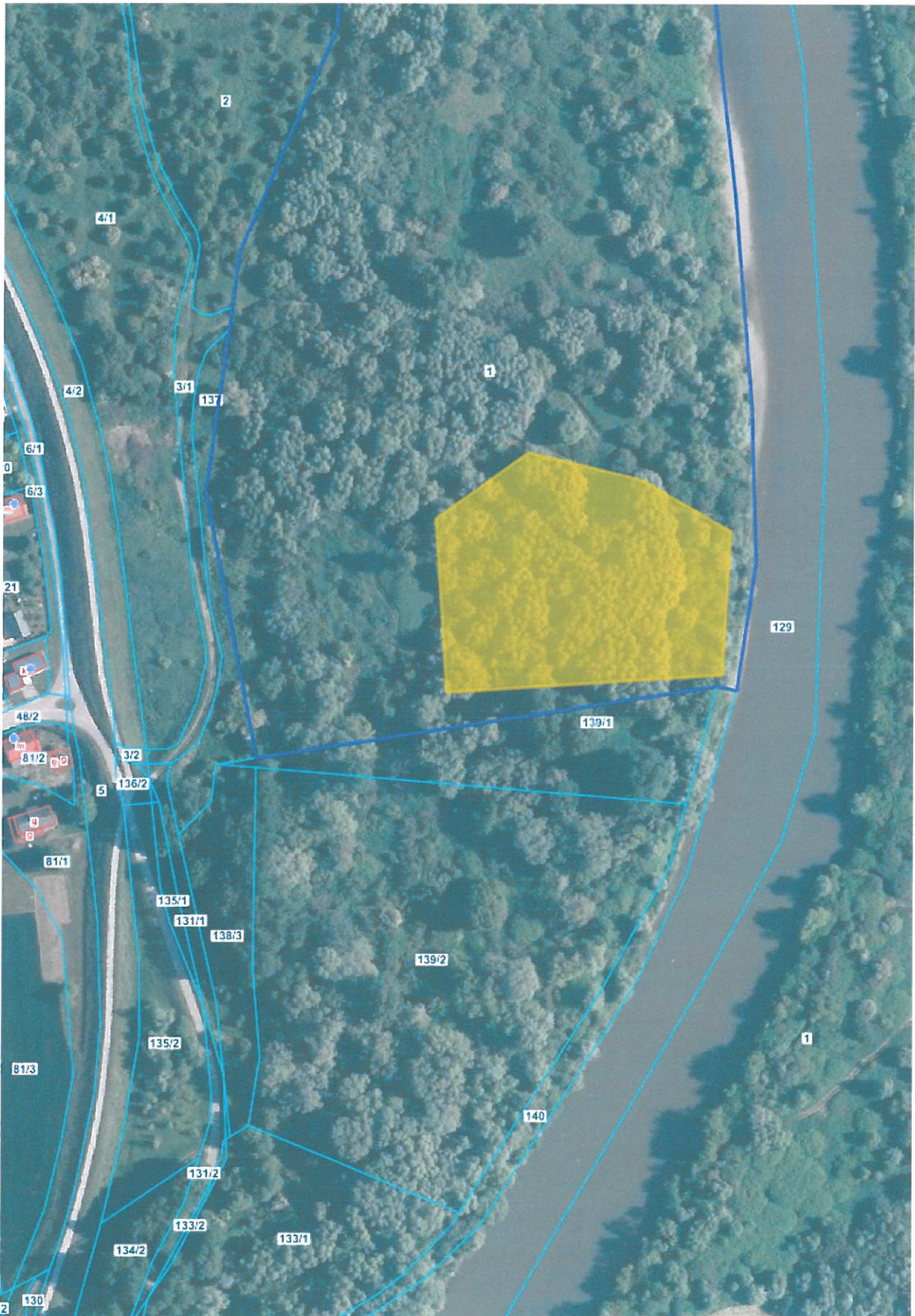
Załącznik nr 1 Lokalizacja wiktyny oferowanej do sprzedaży w kępie nr 23- Sanoka